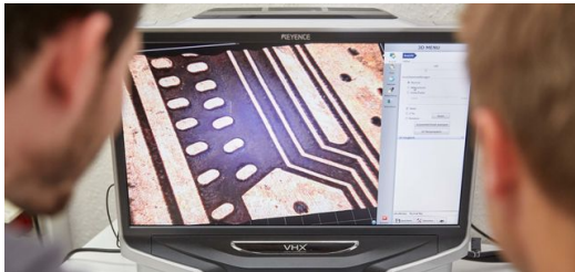
Bei der Sichtprüfung wird der homogene Abtrag dokumentiert. Die Abtragzone ist dunkel und zeigt die Kunststoffoberfläche. In der Bearbeitung kommt es darauf an, die Zwischenräume rückstandsfrei abzutragen, um eine elektrische Isolation zu erreichen.