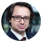
ATHANASSIOS KALIUDIS PRESSESPRECHER TRUMPF LASERTECHNIK TRUMPF MEDIA RELATIONS, CORPORATE COMMUNICATIONS

Ende August wurde die RDX 500 nach rund 26 Wochen Entwicklungszeit an den Kunden ausgeliefert und fertigt nun Leiterplatten in kleinen bis mittleren Serien von 10 bis zu mehreren 1000 Stück für Endkunden aus beispielsweise der Breitbandkommunikation, der Luft- und Raumfahrt oder der Automobilindustrie. Die Spezialisten von Pulsar Photonics haben alle Anforderungen des Kunden erfüllt. Aber nicht nur das: die Ultrakurzpuls-Spezialisten haben ein weiteres Mal bewiesen, dass durch die optimale Verknüpfung und Ansteuerung der einzelnen Komponenten sowie mit intelligenter Software auch diese komplizierte Technologie ganz einfach sein kann.