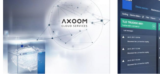
Ein ausgewählter Teil wird über das Internet an die AXOOM Cloud weitergeleitet.