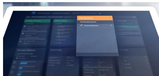
Alle von den Lasersystemen weitergegebenen Daten sind Daimler bekannt und werden sicher verschlüsselt übertragen.