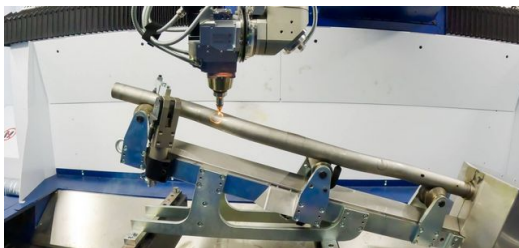
Mit der 3D-Laseranlage TruLaser Cell 8030 von TRUMPF lassen sich präzise Konturen ausschneiden, die vor dem Biegen nicht eingebracht werden können, weil sie sich sonst verformen würden.